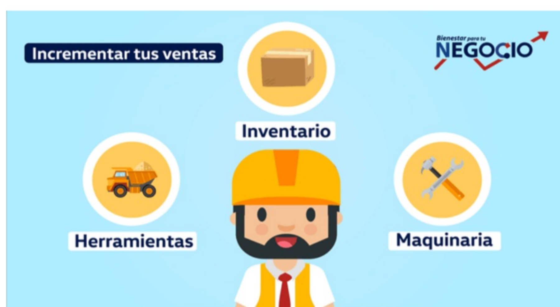
Figura 1: Bienestar para tu Negocio ayuda a los clientes a incrementar sus ventas otorgándoles el crédito necesario para adquirir inventario, herramientas y maquinaria.

Trabajando con Accion, Caja Bienestar está abordando la falta de acceso al crédito mediante el desarrollo de una línea de crédito rotativa para microempresarios llamada Bienestar para tu Negocio . Este producto de crédito no solo ayudará a los pequeños comerciantes a acceder más fácilmente al financiamiento y a la reposición de inventarios, sino que también brindará asesoramiento financiero para mejorar su rotación y ayudar a los empresarios a desarrollar las capacidades para cumplir sus objetivos y estabilizar sus ingresos en tiempos difíciles. Los distribuidores que venden sus productos a los pequeños comercios también se benefician ya que optimizan sus ventas y transfieren el riesgo crediticio a Caja Bienestar.